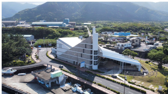
屋久島環境文化村センター （屋久島町宮之浦）

※ 公益財団法人屋久島環境文化財団ホームページ https://www.yakushima.or.jp/