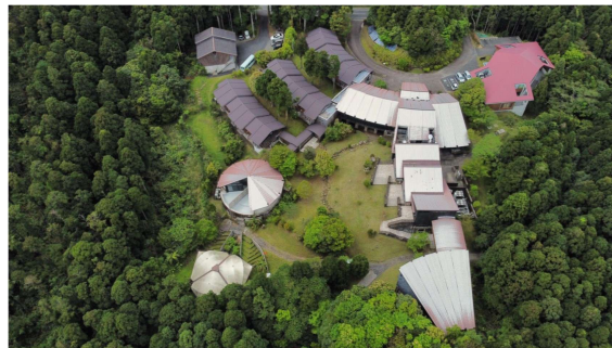
屋久島環境文化研修センター （屋久島町安房）