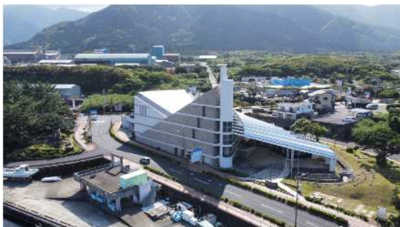
屋久島環境文化村センター （屋久島町宮之浦）

※ 公益財団法人屋久島環境文化財団ホームページ https://www.yakushima.or.jp/