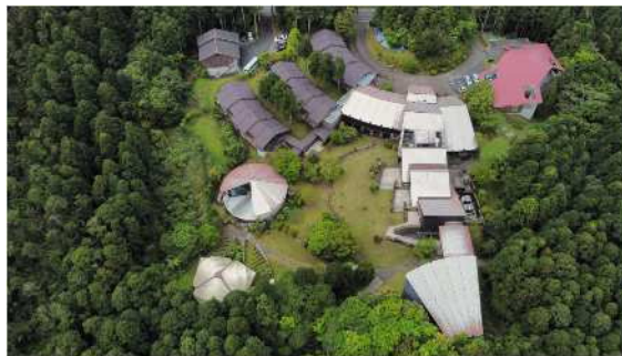
屋久島環境文化研修センター （屋久島町安房）