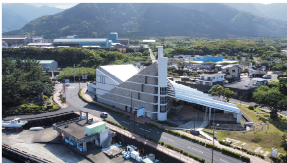
屋久島環境文化村センター (屋久島町宮之浦)

※ 公益財団法人屋久島環境文化財団ホームページ https://www.yakushima.or.jp/