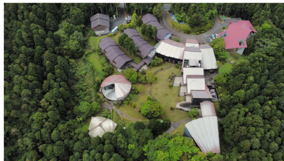
屋久島環境文化研修センター (屋久島町安房)